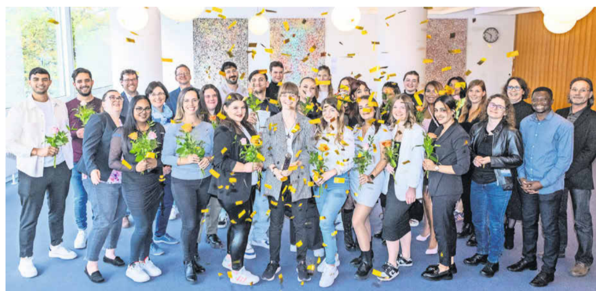
Grund zu feiern hatten die Absolventinnen und Absolventen der Berufsfachschule für Pflege der RKH Kliniken Ludwigsburg-Bietigheim.