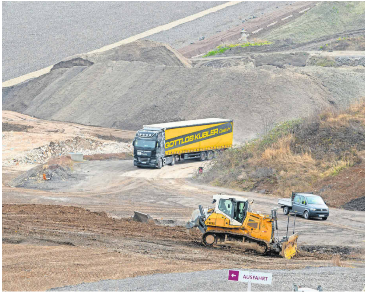
Eine Alternative zur Horrheimer Deponie soll gefunden werden. Der Verband Region Stuttgart muss nun zügig Daten sammeln und nach weiteren Standorten suchen.

Freilich müsse man sich im Klaren darüber sein, dass von den ersten Planungen eines Deponiestandortes bis zu dessen Inbetriebnahme in der Regel zehn Jahre ins Land ziehen. Der AVL-Aufsichtsrat hat die Geschäftsführung deshalb beauftragt, mit den Partnern nach einer verbindlichen Übergangslösung zu suchen, in der geregelt wird, dass der VRS eine Standortsuche für eine Deponie vorantreibt und auch die anderen Entsorgungsträger mit Deponien im Verbandsgebiet ihre Kapazitäten verstärkt zur Verfügung stellen. Dies erfolgte bislang in wenigen Schritten.